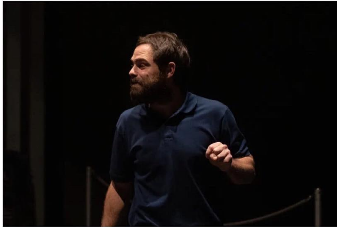
Peter Lanzani, en Las cosas maravillosas Sergio Bosco - Gentileza Multiteatro